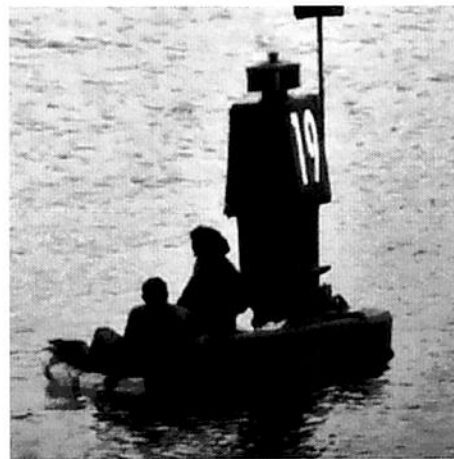
Figura N°2 Bañistas haciendo uso indebido de la boya