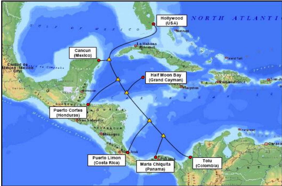
Cuadro N°1 Recorrido Cable Maya-1